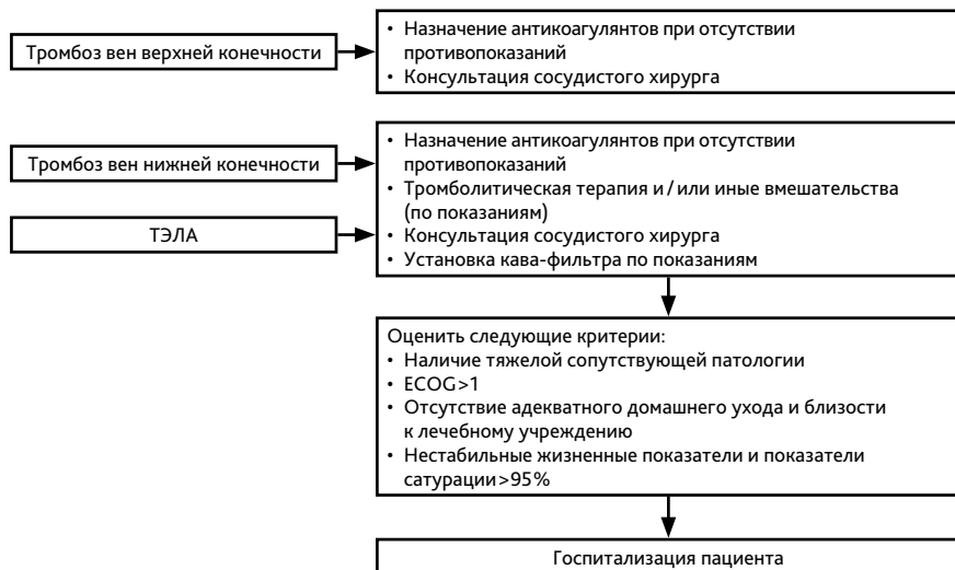
Рисунок 2. Тактика врача при развитии ВТЭО