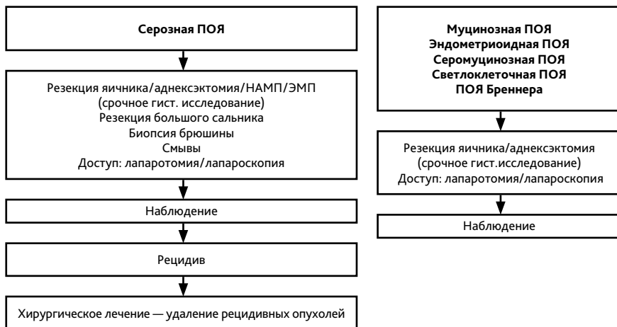
Рисунок 2. Лечение пограничных опухолей яичника