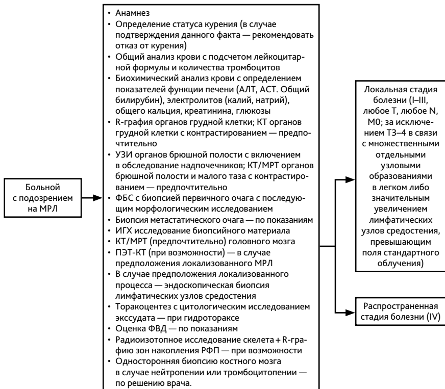
Рисунок 1. Рекомендуемый алгоритм обследования с подозрением на МРЛ